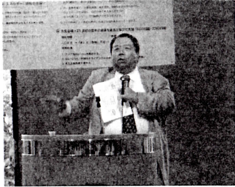
元国務大臣・村上誠一郎衆議院議員による講演

自民党敗北の原因については、小選挙区制導入により人材の新陳代謝が進みにくくなったことや、