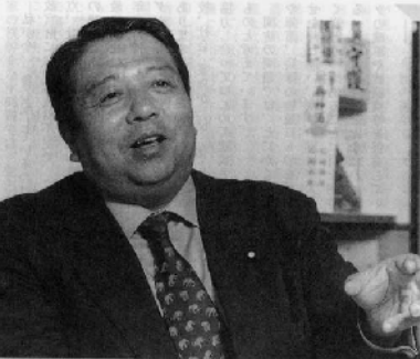
日本企業の生産性が欧米の六割程度とされています。...

日本企業の生産性が欧米の六割程度とされています。まさに先鋒的地位にあると言っても過言はななく、生産性・効率性の向上と反動緩和、新事業の創出を図り、日本の産業の国際競争力を回復させなければなりません。